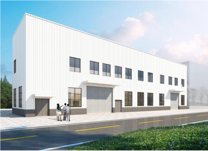
旌德县蔡家桥镇乔亭村脱水蔬菜加工厂房项目建设工程设计方案