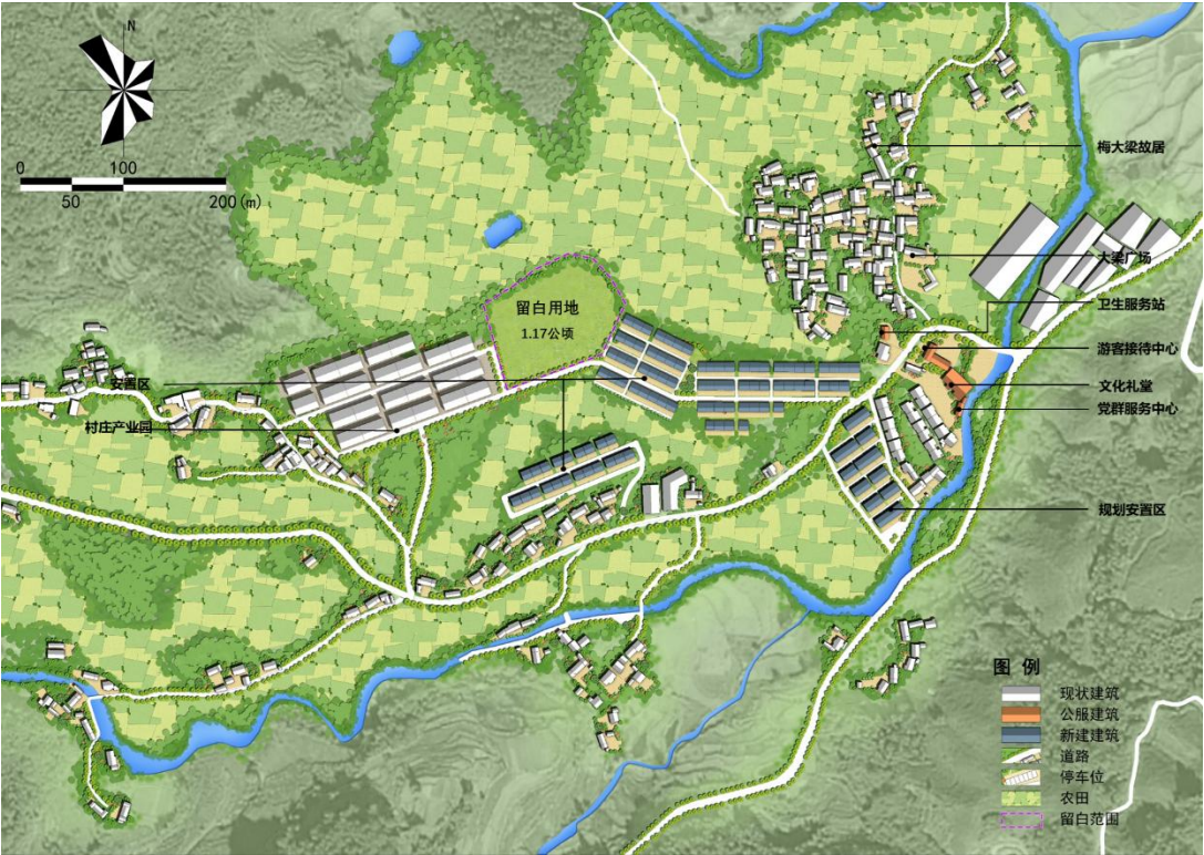
龙川村重点区域总平面图